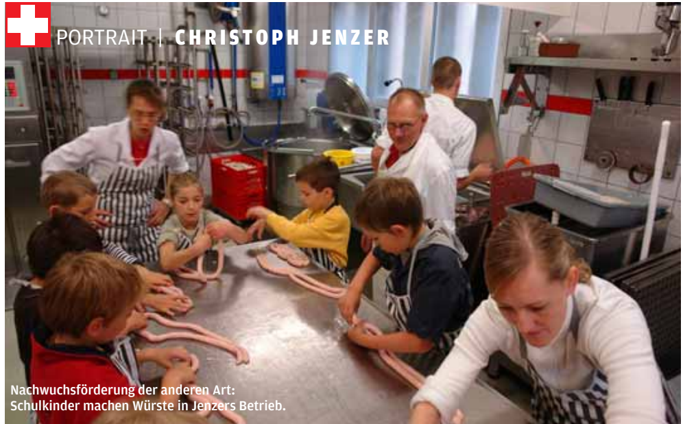
Nachwuchsförderung der anderen Art: Schulkinder machen Würste in Jenzers Betrieb.