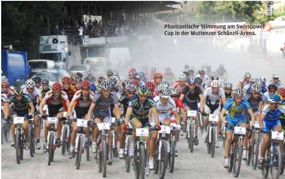
Phantastische Stimmung am Swissspower Cup in der Muttenzer Schänzli-Arena.